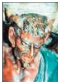
La littérature ésotérique se vend bien. Le «pog» cathare de Montségur attire quelques illuminés. Rennes-le-Château également, pour son «curé aux milliards», sa Tour Magdala, son diable incongru dans l'église du lieu et ses hypothétiques trésors cachés.